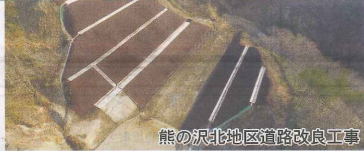
熊の沢北地区道路改良工事